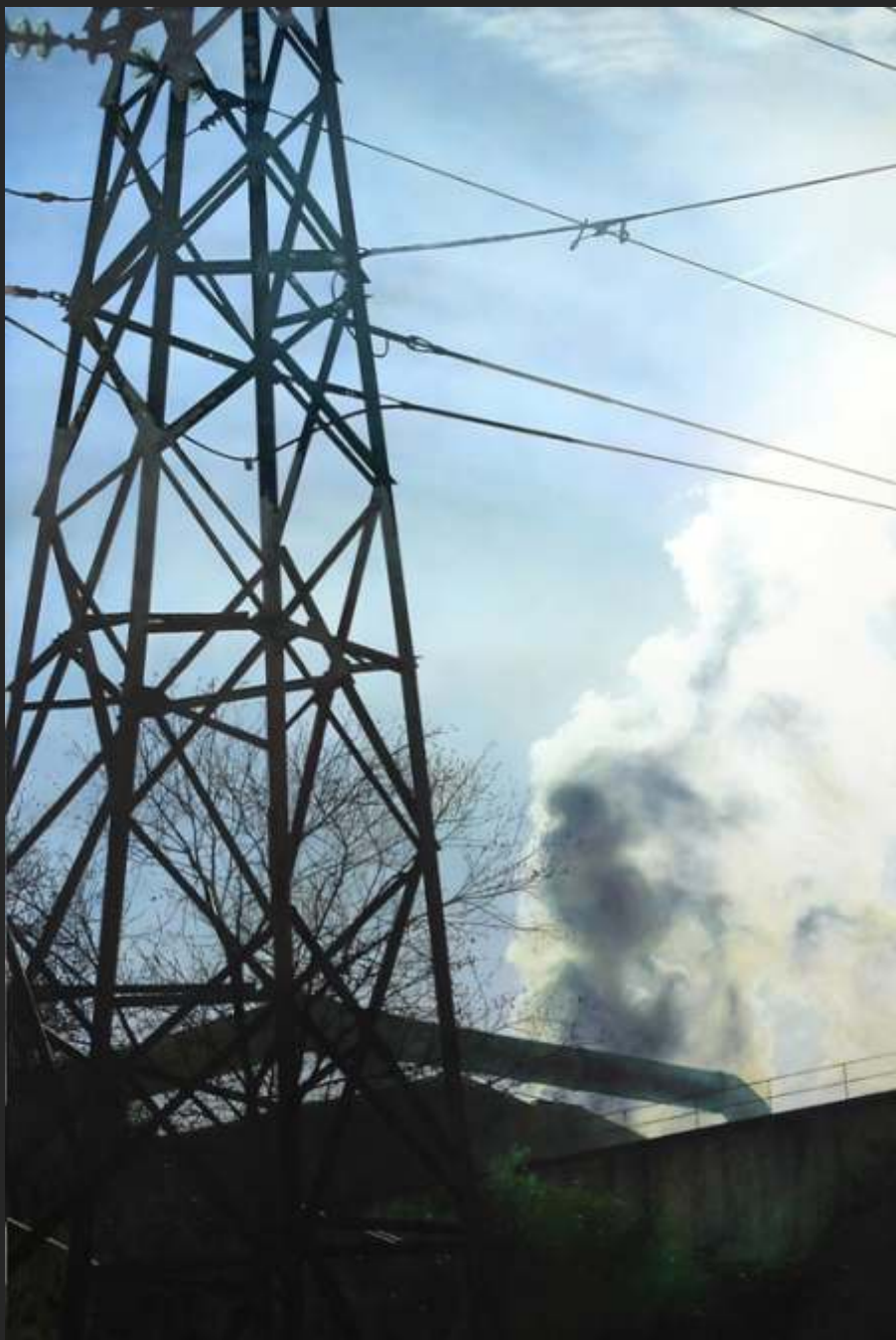
"INDUSTRIA" 195 x 130 cm acrílico y óleo/tabla