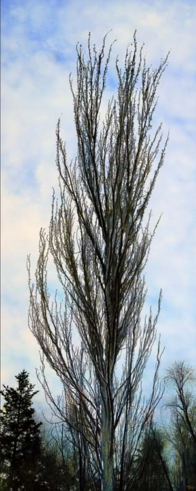
"CHOPO" 110 x 45 cm acrílico y óleo/tabla