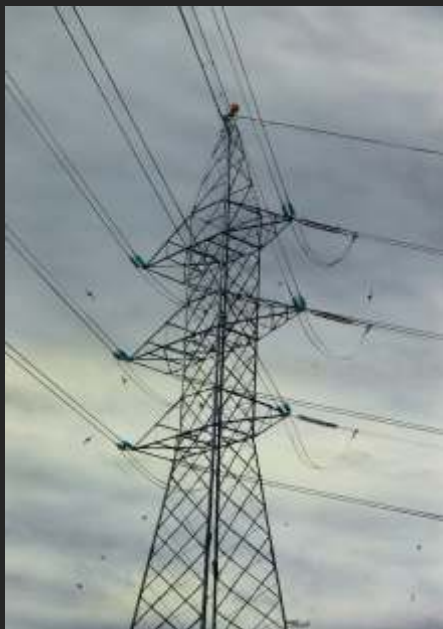
POSTE ELÉCTRICO 42 x 30 cm carbón/ papel encolado a tabla