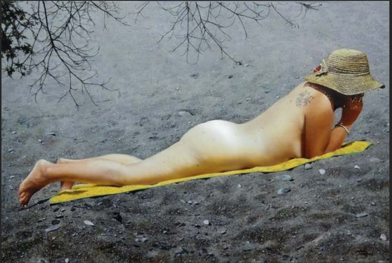
"SOMBRERO" 40 x 60 cm acrílico y óleo/tabla