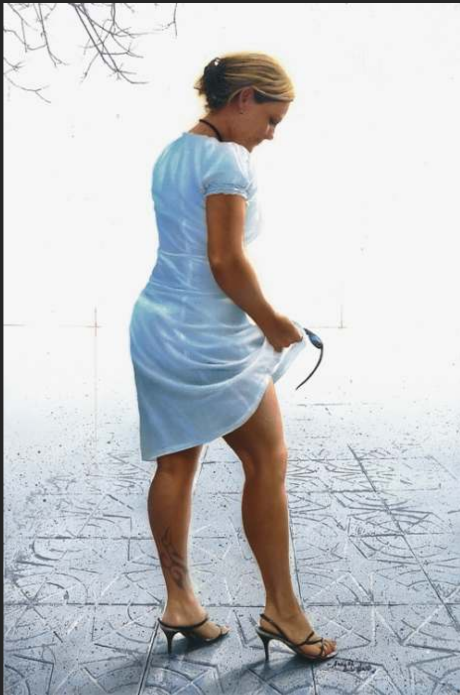
"PATRICIA" 60 x 40 cm acrílico y óleo/tabla