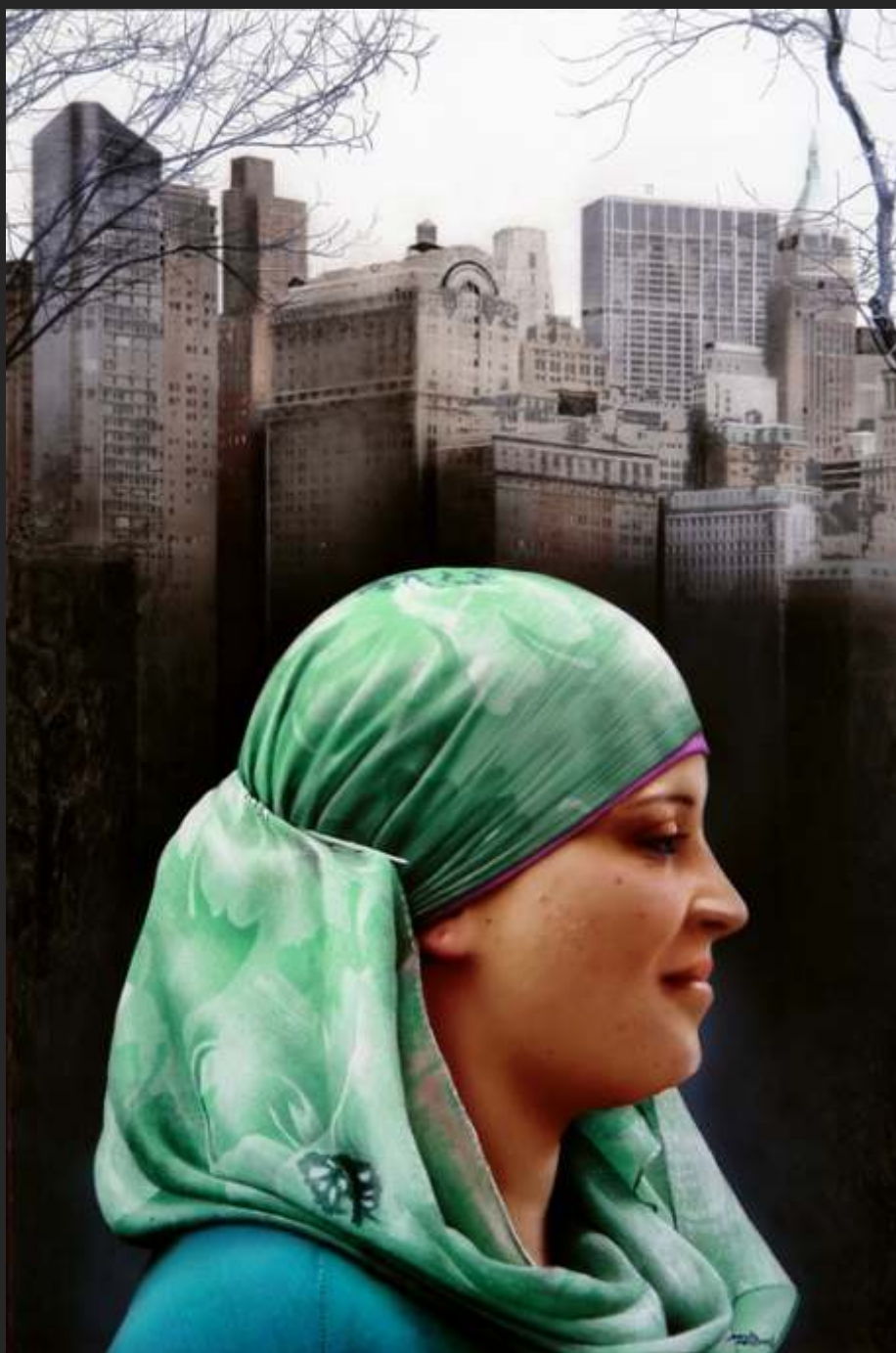
"AAMINAH" 60 x 40 cm acrílico y óleo/tabla