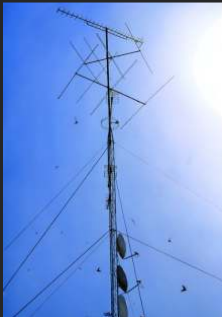
ANTENA 42 x 30 cm carbón/ papel encolado a tabla